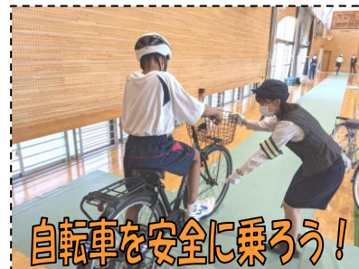
自転車を安全に乗ろう！

免許更新時・新規免許取得時に運転免許センターで、または松山南交通安全協会の窓口で入会できます。年会費 500 円×免許の有効年数分の会費を納めていただくと、チャイルドシートや交通安全DVDの無料貸出、交通事故入院見舞金制度の適用などの特典があります。地域の交通安全のため、みなさまのご支援・ご協力をよろしくお願い致します。