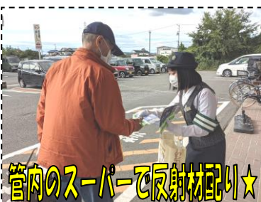
管内のスーパーで反射材配り★