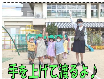
手を上げて渡るよ！

皆様からいただいた「交通安全協会費」は、春・秋・年末の交通安全運動や、子ども・高齢者の交通安全教室等に活用させていただいています。