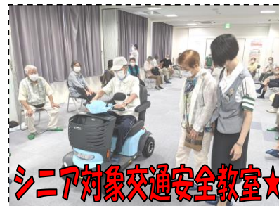
シニア対象交通安全教室★