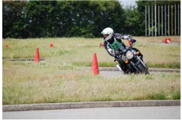
(二輪車大会 一般Aクラス 400cc)