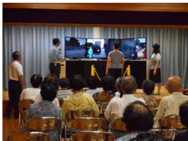
(歩行者シミュレーター講習会)