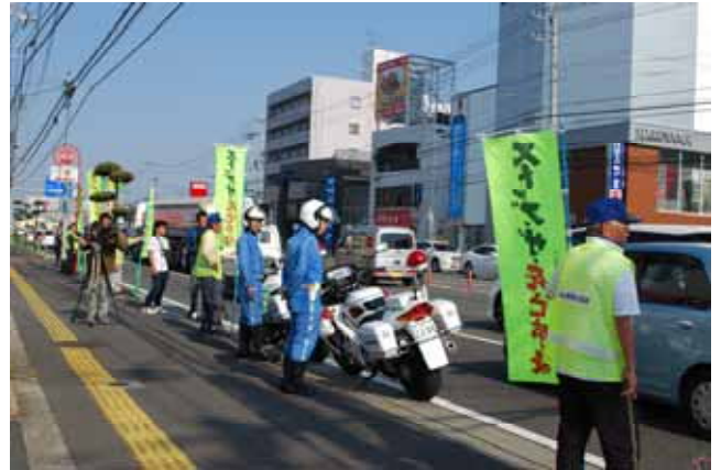
(交通死亡事故抑止 人の輪作戦)