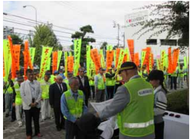
(秋の全国交通安全運動出動式)