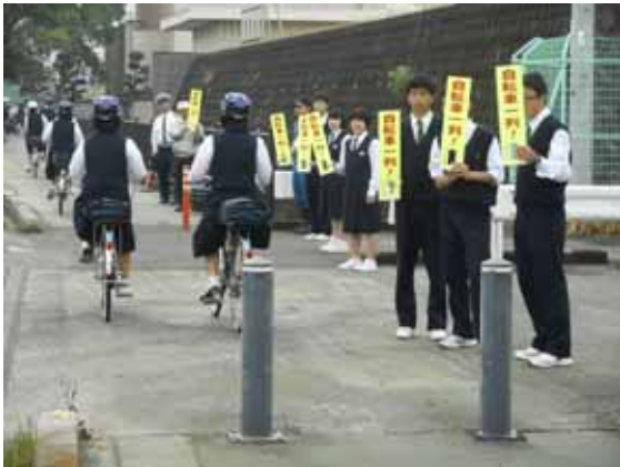
(自転車安全利用の日 街頭指導)

計14回、約1,625個の反射材を配布し、反射材着用者が増加するなど非常に高い効果があった。