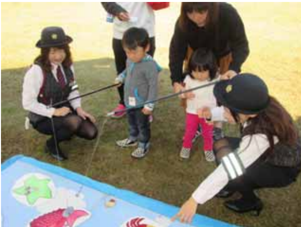
(親子交通安全ふれあいフェア)

4月10日(月)・9月21日(木・事前広報)に、松山市(天山交差点)および東温市(フジグラン重信前)で、当協会全支部、松山南警察署、松山南警友会、松山南地区地域交通安全活動推進委員協議会、愛媛県トラック協会等の総勢304名が、「交通事故死ゼロを目指す日」として常駐型交通茶屋を実施し、交通量の多い主要幹線道路を走行するドライバーに「ストップ・ザ・死亡事故」の旗を掲示して交通死亡事故抑止を訴えた。併せて近隣大型店舗で反射材の配布活動を行い歩行者には夜間事故防止を呼びかけた。