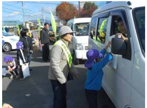
(交通茶屋と人の輪作戦)