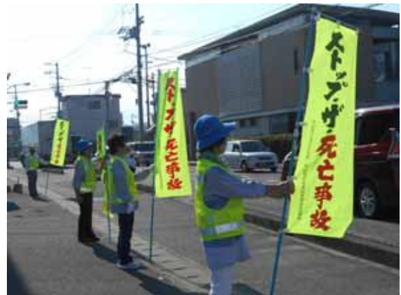
(交通死亡事故抑止 人の輪作戦)