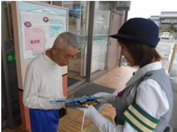
(交通安全の日 反射材配り)