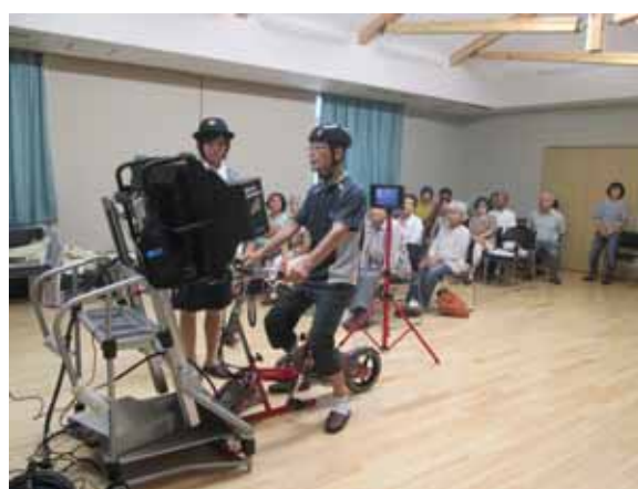
(自転車シミュレーター講習)