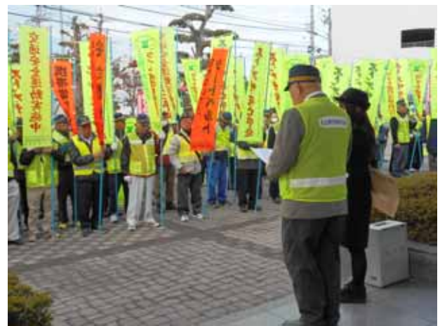
(秋の全国交通安全運動出動式)