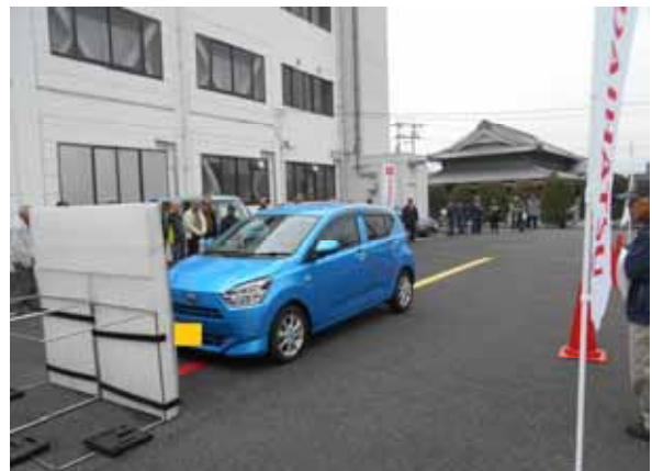
(安全運転サポート車を活用した高齢者講習)